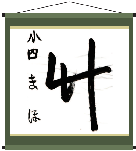
瑞蓮書道教室 (長沢団地バス停側)