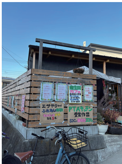
にやあちゃん(長沢在住)

個人が行っているため、地域企業からの出資、有志の方持ち寄り、そして多くのボランティアさんによって運営されているそうです。次回の子ども食堂は、4月19日(土)開催予定です。