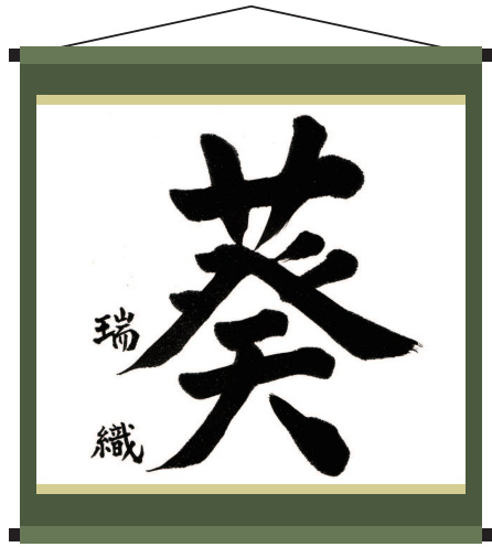
瑞蓮書道教室(長沢団地バス停側)