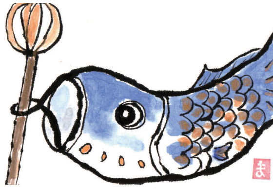
さし絵 ままちゃん(南生田在住)

大きな目玉をぐりぐりさせているもの、ウロコをくつきりと浮かび上がらせているもの、体をくねら