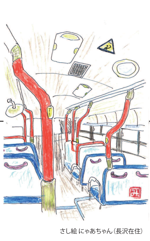
さし絵にゃあちゃん(長沢在住)

川崎市のバスは市民の足で、私もどこに行くにも利用する。乗るたびに必ず手すりの感触を確認する。そして、通学途中に大けがを負い、人生が大きく変わってしまったかつての女生徒はどうしているかと思う。あの時の教え子案する先生の無念さはいかばかりであったかと思う。